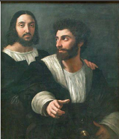
“Autoritratto con un amico”