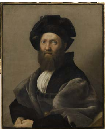
“Ritratto di Baldassarre Castiglione”