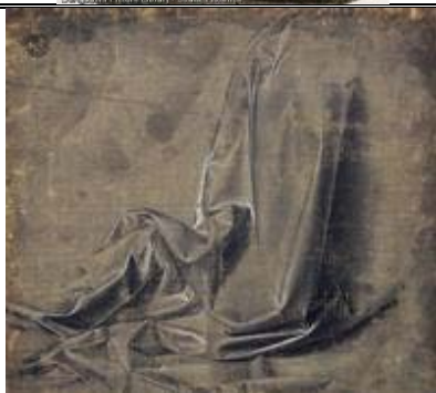
“Studio di panneggio” inv. 420 E