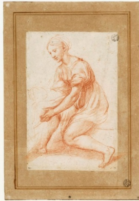
“Studio per Fanciulla seduta”, inv. 3862