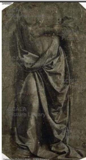
“Studio di panneggio” inv. 433 E