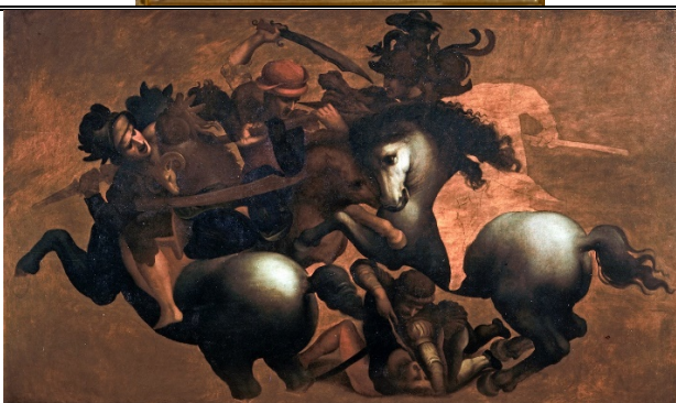
“La Battaglia di Anghiari”, inv. 1890, n. 5376