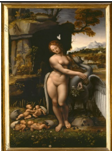
“Leda”, inv. 1890, n. 9953