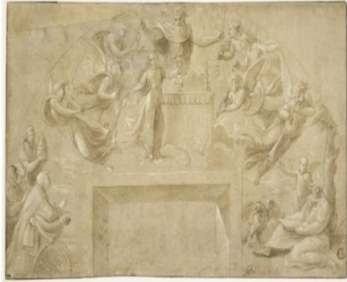
“Studio per San Giovanni e Giulio II” ( recto ), “Studio per la messa di Bolsena ( verso ), inv. 3866