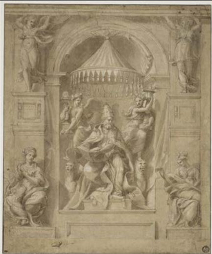
“Studio per Papa seduto”, inv. 4304