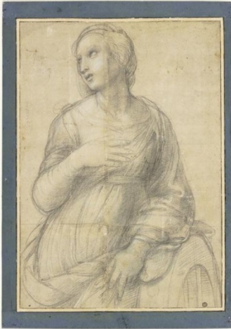
“Studio per Santa Caterina d’Alessandria”, inv. 3871