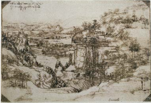
“Studio di Paesaggio” inv. 8 P