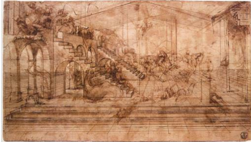
“Studio per l’ Adorazione dei Magi” inv. 436 E