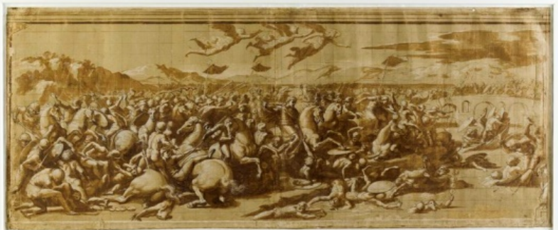
“Studio per la Battaglia di Costantino contro Massenzio”, inv. 3872