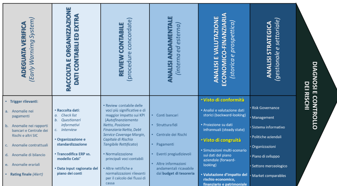
Figura 1 – modello generale del sistema di diagnosi, monitoraggio e controllo dei rischi.

Nella figura 1 è riportato il modello generale del sistema di diagnosi, controllo e monitoraggio dei rischi economico-finanziari.