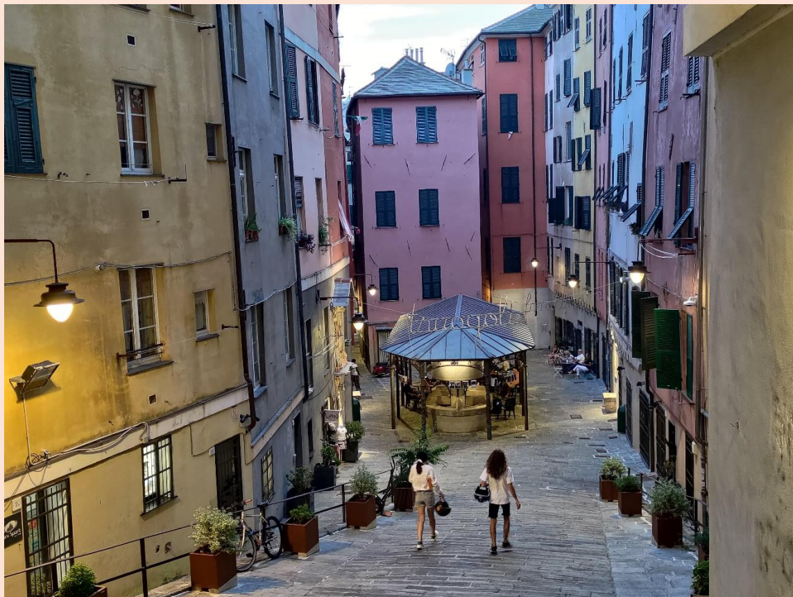
Genova 2022, da Via Balbi – Troegi di Santa Brigida