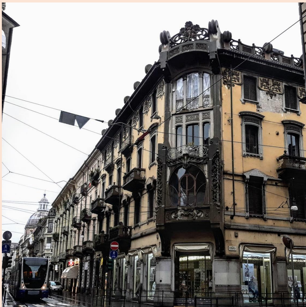
Fotocredits – Ettore