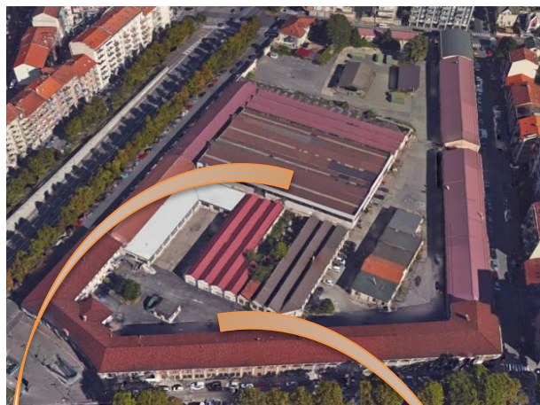
Piazza Rivoli, 4 CASERMA AMIONE